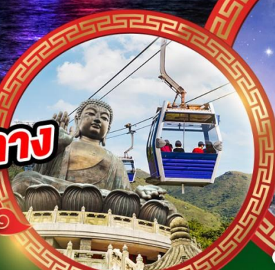
พระใหญ่นองปิง