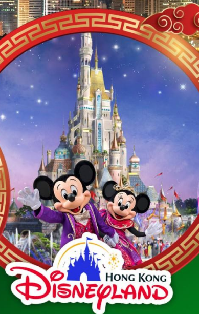
HONG KONG Disneyland