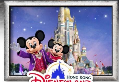
Disneyland HONG KONG

ชมการแสดง แสง สี เสียง Symphony of Lights