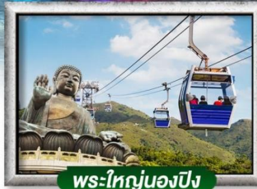
พระใหญ่นองปิง